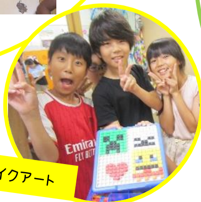
完成！モザイクアート